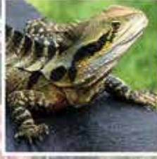
イースターン ウォータードラゴン 半水生のトカゲで90cmまで成長します。