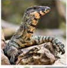
レースモニター 黄色と灰色の模様があり、2mまで成長します。