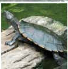
ノコヘリカブトガメ このあたりで良く知られている亀でおたまじゃくしや昆虫、小魚を食べます。