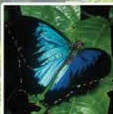
クリシスバタフライ 美しく光沢のある青色の羽を持ちクィーンズランド州のツーリズムの象徴として描かれることもあります。両翼を広げると14cmまで成長します。