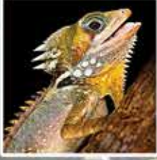
ボイドレイ フォレストドラゴン 木の上に住むトカゲでオーストラリア北部の熱帯雨林にだけ生息しています。