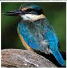
カワセミ亜科 ヒメミツユビカワセミ、ルリミツユビカワセミ、モリショウビンなどはクィーンズランド北部でよく見られる種類です。あり塚の中に巣を作ります。