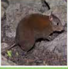
マスキーラット カンガルー カンガルー科の中では最小のカンガルーです。約30cmぐらいまでしか成長はしません。