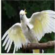
サルファークレスト コカトゥー オーストラリアの象徴の鳥として親しまれており、特徴的な呼び名でよく知られています。野生で40歳ぐらいまで生きます。