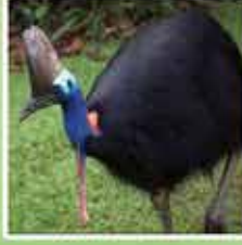
サザンカソワリ 絶滅危惧種に指定されています。3番目に大きな飛べない鳥です。野生では2000頭しか残っていません。