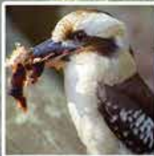
ワライカワセミ カワセミ科の中で最大種となります。鳴き方が人の笑い声に似ていることで知られています。