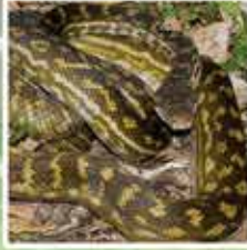
スクラブパイソン オーストラリア最大の蛇で、最大8mにまで成長します。