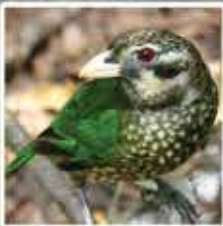
キャットバード ニワシドリ科の一種になります。猫のような鳴き声を発することから、この名前がつけられました。