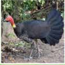
ブッシュターキー 数羽で共生用の大きな巣をつくり、若いひな鳥は自分たち自身で身を守らなくてはけません。