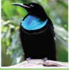
オオウロコ フウチョウ “楽園の鳥”と言われるこの鳥自慢の美しい青色は求愛のために使われます。