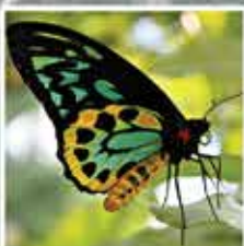
ケアンズ バードウィング バタフライ オーストラリア最大の蝶で翼を広げると20cmにもなります。

世界遺産に囲まれた40ヘクタール(東京ドーム8.5個分)に及ぶ熱帯雨林の年間平均降水量は、2500mmに達します。クィーンズランド北部の温潤熱帯地は世界遺産に登録されており、オーストラリアの保護された自然地区“王冠の宝石”と言われ注目されています。熱帯雨林に生息している生物の多様性は、甲虫と蛾の種だけを取っても、グレートバリアリーフのすべての生物より多いとされています。熱帯雨林には200種以上の鳥たち、オーストラリア全土の60%以上の蝶がおり、さらに7.5m以上にも成長するアメジストニシキヘビ、最大15cmのカエル、グリーンツリーフロッグ、そして翼を広げると25cmにもなる蛾、ヘラクレスモスなどの生息地でもあります。では、注意して探してみましよう。